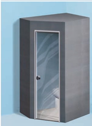
Sanoasa Toretta, mit Flachdach