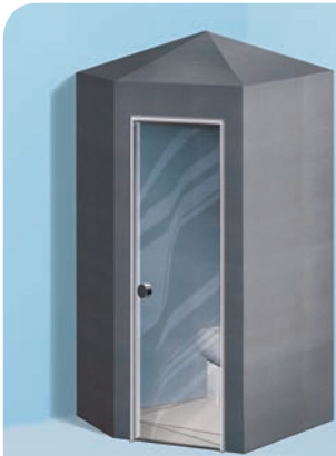
Sanoasa Toretta, mit Spitzdach