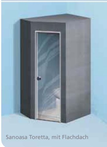
Sanoasa Toretta, mit Flachdach