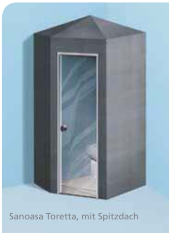
Sanoasa Toretta, mit Spitzdach