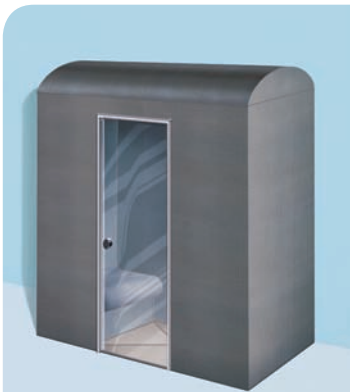
Sanoasa Pergola, mit Tunneldach