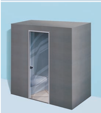
Sanoasa Pergola, mit Flachdach