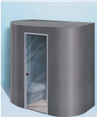
Sanoasa Capricia, mit Flachdach