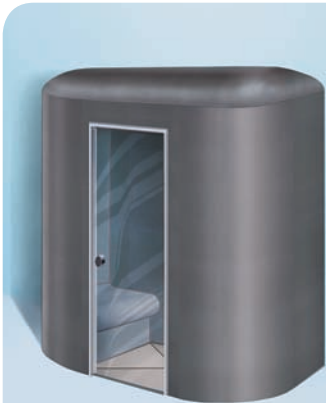
Sanoasa Capricia, mit Kuppeldach