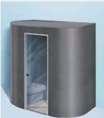
Sanoasa Capricia, mit Flachdach