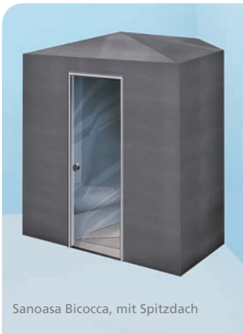
Sanoasa Bicocca, mit Spitzdach