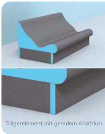
Trägerelement mit geradem Abschluss