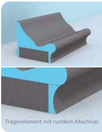
Trägerelement mit rundem Abschluss