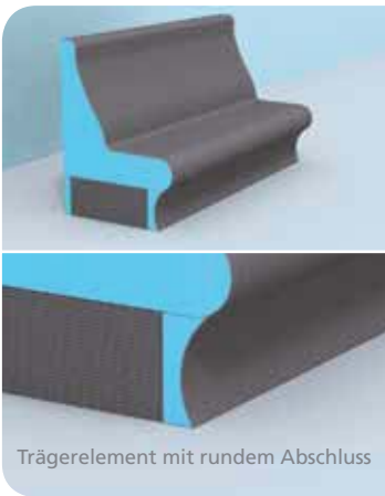
Trägerelement mit rundem Abschluss