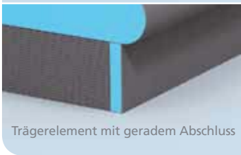
Trägerelement mit geradem Abschluss