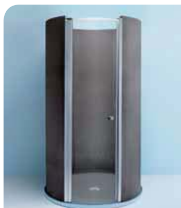
Glaspendeltür in Fundo Trollo, Design-Dusche