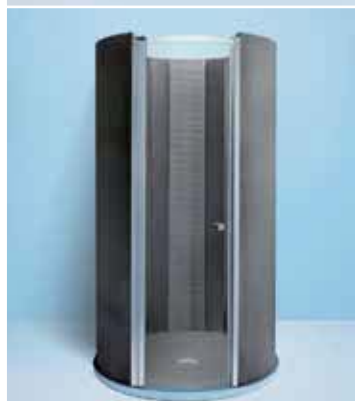
Glaspendeltür in Fundo Trollo libero , Design-Dusche